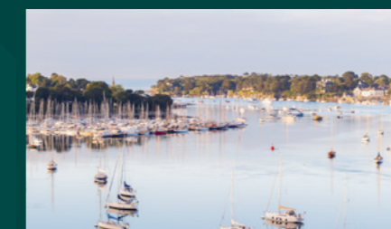
Port de Bénodet sur l'Odet

Prenez à gauche et vous longerez le front de mer jusqu'à la plage du Letty où vous découvrirez une lagune naturellement préservée offrant un spectacle exceptionnel .