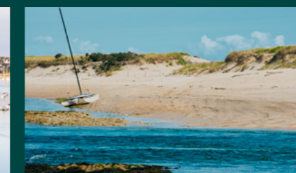
Lagune naturelle de Letty